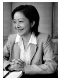
クラーク・フューチャー・コンサルタンツ 有限公司 代表取締役 人財能力開発コンサルタント キャリアコンサルタント

では、1ヵ月といわれたら.... 時間がなくてできないと、後回しにしてきたもの、本当に自分にとって大事だったら、やってみませんか。 自分の大切なもの、大切な人、それは何ですか? 限りある人生ならば、やはり、自分の信じること、自分の大切にしたいものを大切にする、周囲の人を大切にしてい、 かけがえのない「ありのままの自分」を大切にする道を歩めたらいいですね。 また、来年も開催します! 会場でお目にかかりますことを楽しみにしております♪